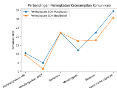
Gambar 3. Perbandingan peningkatan keterampilan komunikasi peserta didik antara SDN Pusakasari dan SDN Budibakti

Hasil pada Gambar 2 menunjukkan bahwa seluruh indikator keterampilan komunikasi juga mengalami peningkatan setelah penerapan pembelajaran kolaboratif, meskipun peningkatannya tidak sebesar yang terjadi di SDN Pusakasari. Perbandingan peningkatan keterampilan komunikasi peserta didik pada kedua sekolah disajikan pada Gambar 3.