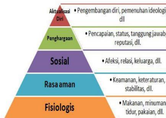
Gambar 1. Teori Hirarki Maslow